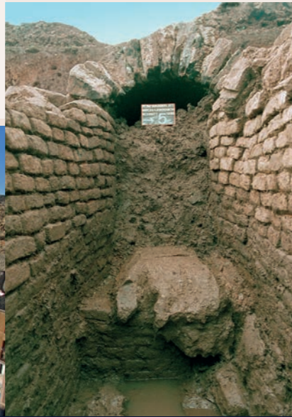
Een archeologische ontdekking: de aansluiting van twee bouwsectoren in het verloop van de Romeinse waterleiding (Mechernich-Lessenich)

Geen enkele waterleiding in het Imperium Romanum is zo goed onderzocht als de Eifel Waterleiding naar Keulen. In andere waterleidingen zijn zelden zoveel verschillende technische snufjes gevonden als hier bij de Rijn.