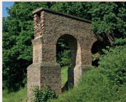
Mechernich-Vusse: aan de hand van vondsten gereconstrueerde aquaductbrug

Het was een archeologische sensatie toen hier de indeling in ongeveer 5 km lange bouwsectoren in een antiek bouwproject archeologisch gedocumenteerd werd. Een zwaar uitgevoerd kalmeringsbekken vormde de aansluiting van twee zulke bouwsectoren. Bronvattingen, bruggen, verzamelbekkens en bezinkingsbekkens konden archeologisch worden onderzocht om ze aansluitend te restaureren. Waar nodig is er een beschermend gebouw overheen gezet zodat die delen van de leiding aan het tracé van de Römerkanal wandelroute – een van de eerste archeologische wandelroutes in Duitsland – voor iedereen toegankelijk zijn. De tentoonstelling gebruikt fotos, opgravingsdocumenten en modellen om de vele technische snufjes goed te laten zien.