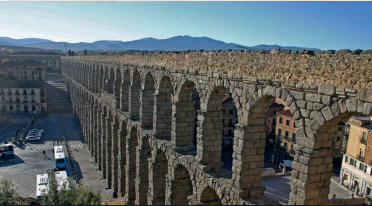
Aquaductbrug in Segovia (Spanje) – deel van de Romeinse waterverzorging, maar ook een demonstratie van Romeinse macht?

Het lijkt wel of de Romeinse ingenieurs al hun kunnen bij de bouw van waterleidingen hebben willen etaleren. Bij aquaductbruggen worden dimensies zichtbaar die de grenzen van de zwaartekracht lijken te overschrijden. Bij het bepalen van de helling van de leiding werd een nauwkeurigheid bereikt, die soms twijfel aan huidige metingen doet rijzen. Daaraan kan men de grondige voorbereiding en het nauwkeurige bestek herkennen.