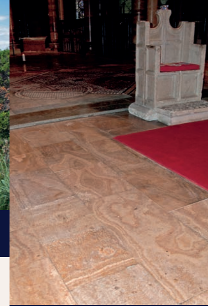
Een export succes uit de Middeleeuwen: kalkafzetting uit de Eifel waterleiding als aquaduct marmer voor de vloer van de bisschopstroon in

In de hoge Middeleeuwen waren de lange routes waarlangs marmer uit de groeven in noord Italië was gehaald niet meer voor zware transporten te gebruiken. Daardoor ontbrak ten noorden van de Alpen mooi gesteente voor grote bouwwerken en de bouwmeesters zochten naar vervangend materiaal. Ten tijde van de in de Romaanse stijl gebouwde kerken, kloosters en burchten sloopte men vaak de in onbruik geraakte waterleiding vanwege het bouw materiaal. Maar een speciaal doel was de kalkafzetting, die door geoefende steen- en beeldhouwers tot een heel bijzonder soort marmer werd verwerkt.