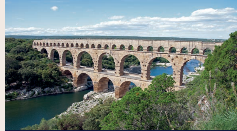
Nîmes (zuid Frankrijk): Pont du Gard

Het was een archeologische sensatie toen hier de indeling in ongeveer 5 km lange bouwsectoren in een antiek bouwproject archeologisch gedocumenteerd werd. Een zwaar uitgevoerd kalmeringsbekken vormde de aansluiting van twee zulke bouwsectoren. Bronvattingen, bruggen, verzamelbekkens en bezinkingsbekkens konden archeologisch worden onderzocht om ze aansluitend te restaureren. Waar nodig is er een beschermend gebouw overheen gezet zodat die delen van de leiding aan het tracé van de Römerkanal wandelroute – een van de eerste archeologische wandelroutes in Duitsland – voor iedereen toegankelijk zijn. De tentoonstelling gebruikt fotos, opgravingsdocumenten en modellen om de vele technische snufjes goed te laten zien.