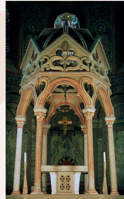
Klooster Maria Laach (tussen Bonn en Koblenz): de voorste twee zuilen van het baldakijn over het hoogaltaar zijn van kalkafzetting uit de Romeinse waterleiding gemaakt

Bij gebrek aan ander mooi materiaal heeft men in de tijd van de Romaanse stijl aquaduct marmer gebruikt om bouwwerken te verfraaien. Dit materiaal werd in heel Europa verkocht: alle domkerken langs de "Hellweg" (van Duisburg via Paderborn naar de Elbe), de kathedraal van Roskilde in Denemarken en van Canterbury in Engeland hebben, net als vele kerken in Nederland, zuilen, altaren of grafstenen van aquaduct marmer.